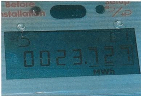
Fig.1 Index MW/h

Contoarele de energie termica dețin urmatoarele informati: