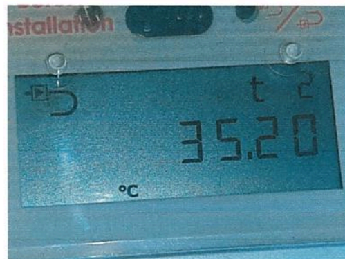
Fig.4 T2-temp iesire agent termic