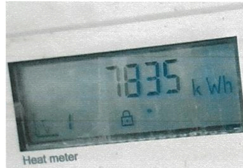
Fig.2 Index kW/h