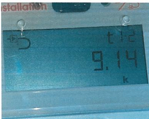
Fig.5 Diferenta T1-T2