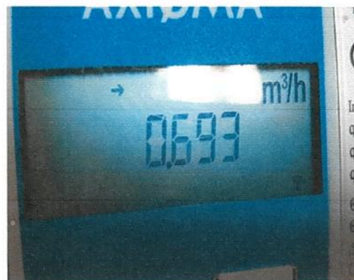
Fig.6 Debit m³/h