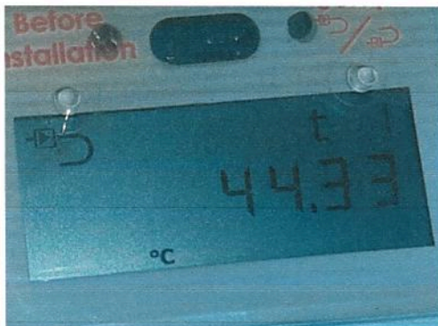
Fig.3 T1-temp intrare agent termic